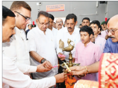
कहा कि हिमालय की वादियों की दिलिय ऊजां व्यक्ति के भीतर सोए हुए गौरव को जागृत करती है।