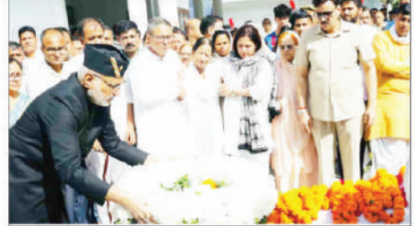
शोक प्रकट किया। उन्होंने कहा कि देश के विकास में उनका योगदान मील के पत्थर के रूप में बचाने रहेगा। उनके निधन से देश एक विशिष्ट सैनिक, सक्षम प्रशासक और असाधारण सत्यनिष्ठ वाले राजनेता को खो दिया है। उपराष्ट्रपति आज सुबह खंडूड़ी को श्रद्धांजलि देने उनके बसंत विहार स्थित घर पहुंचे। यहां उन्होंने उनके पार्थिव शरीर को श्रद्धांजलि दी।

देहरादून हमारे संवाददाता 49 दिनों से अस्पताल में भर्ती पूर्व सीएम मेजर जनरल बीसी खंडूड़ी का मंगलवार सुबह निधन हो गया। उनके निधन की खबर से प्रदेश में शोक की लहर दौड़ गई। उपराष्ट्रपति सीपी राधाकृष्णन ने उनके निधन पर गहरा दुःख व्यक्त किया। देहरादून उनके आवास पर पहुंचकर उपराष्ट्रपति ने श्रद्धांजलि दी। इस दौरान सीएम धामो सहित कई राजनेता उन्हें श्रद्धांजलि देने पहुंचे। उपराष्ट्रपति सीपी राधाकृष्णन ने पूर्व सीएम मेजर जनरल बीसी खंडूड़ी (सेनि.) के निधन पर गहरा