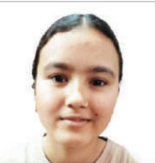
श्रेणीवार परिणाम की बात करें तो 7,814 परीक्षार्थी (7,778) सम्मान सहित उत्तीर्ण हुए, 41,507 छात्र (41,328) प्रथम श्रेणी, 34,987 (34,828) द्वितीय श्रेणी और 330 (0.32%) तृतीय श्रेणी में उत्तीर्ण घोषित किए गए।