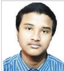
इंटरमीडिएट परीक्षा 2026 का कुल परिणाम 85.11% रहा, जिसमें बालिकाओं ने एक बार फिर बेहतर प्रदर्शन किया। बालिकाओं का पास प्रतिशत 88.09% दर्ज किया गया, जबकि बालकों का 81.93% रहा।