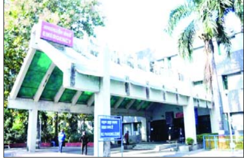
जारी कर दिए हैं। आदेश के मुताबिक, केंद्रीय औषधि भंडार द्वारा रेडियोलांजी विभाग को प्रत्येक मरीज के लिए कन्ट्रास्ट डाई के साथ-साथ सर्जिकल सामग्री, सीरिज, आईवी कैथ सहित अन्य