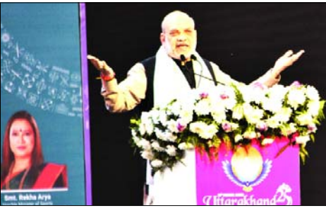
एक साथ राष्ट्रीय खेल कराकर देशभर में देवभूमि की साख बढ़ाई है। साथ ही यहां के खिलाड़ियों को प्रतिभा का प्रदर्शन करने के लिए मंच भी प्रदान किया। शाह ने कहा कि मुख्यमंत्री धामी के नेतृत्व में

हल्द्वानी कार्यालय संवाददाता केंद्रीय गृहमंत्री अमित शाह ने शुक्रवार को हल्द्वानी के अंतरराष्ट्रीय स्टेडियम में 38वें राष्ट्रीय खेलों का समापन किया। उन्होंने कहा कि भारत 2036 के ओलंपिक खेलों की मेजबानी को तैयार है। हमने ओलंपिक की मेजबानी को दावा टोका है। उन्होंने कहा कि राष्ट्रीय खेलों के सफल आयोजन के लिए देश में उत्तराखंड का गुणमान हो रहा है। अपने संबोधन में शाह ने मुख्यमंत्री पुष्कर सिंह धामी की सराहना की। शाह ने कहा, सीएम धामी ने राज्य के विभिन्न क्षेत्रों में