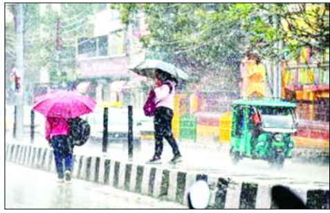
ऊंचाई वाले स्थानों में होने वाली बारिश का तापमान पर कोई खास असर देखने को नहीं मिलेगा। आने वाले दिनों की बात करें तो 13 फरवरी तक प्रदेश भर में मौसम शुष्क रहेगा।

नैनीताल हमारे संवाददाता मौसम विभाग की ओर से पर्वतीय जिलों में आज हल्की बारिश के आसार बताए गए हैं। प्रदेश के पर्वतीय जिलों में आज (सोमवार) हल्की बारिश होने की संभावना है। मौसम विज्ञान केंद्र की ओर से उत्तरकाशी, चमोली, पिथौरागढ़, रुद्रप्रयाग और बागेश्वर जिले के कुछ इलाकों में हल्की बारिश के आसार बताए गए हैं। हालांकि अन्य जिलों में मौसम शुष्क रहेगा। मौसम वैज्ञानिकों का कहना है कि