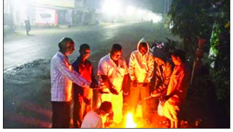
क्षेत्रों में बीते दिनों हुई बर्फबारी के बाद कड़ाके की ठंड पड़ रही है। हल्द्वानी में मंगलवार तड़के तीन बजे से लगा कोहवा करीब सात घंटे बाद सुबह 10 बजे के करीब छट सका। हालांकि उसके बाद भी धुंध छाई रही। दिनभर बादलों की ओट और पछुवा

हल्द्वानी/देहरादून हमारे संवाददाता प्रदेश में मौसम का मिजाज बदल रहा है। प्रदेश के सभी जिलों में सुबह-शाम कड़ाके की ठंड पड़ रही है। मैदानी इलाकों में कोहरे ने ठंड को बढ़ा दिया है, जबकि पर्वतीय क्षेत्रों में बीते दिनों हुई बर्फबारी के बाद कड़ाके की ठंड पड़ रही है। उत्तराखंड में मौसम का मिजाज पल-पल बदल रहा है। प्रदेश के सभी जिलों में सुबह-शाम कड़ाके की ठंड पड़ रही है। मैदानी इलाकों में कोहरे ने ठंड को बढ़ा दिया है, जबकि पर्वतीय