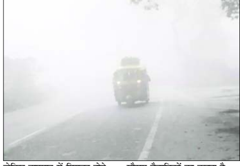
लेकिन तापमान में गिरावट होने से ठंड में इजाफा हुआ है। मौसम वैज्ञानिकों का कहना है कि आने वाले दिनों में भी

मैदानी इलाकों में सुबह-शाम कोहरा छाने और पहाड़ों में पाला पड़ने से तापमान में गिरावट दर्ज की जा रही है। उत्तराखंड में पहाड़ से मैदान तक ठंड का कहर जारी है। बारिश नहीं होने से सूखी ठंड लोगों को परेशान कर रही है। राजधानी देहरादून में आज दिन की शुरुआत कोहरे के साथ हुई। वहीं बादल छाने से तापमान में खासी गिरावट दर्ज की गई है। मसूरी में हालांकि मौसम साफ है,