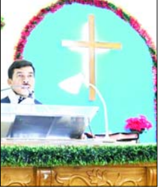
कैथोलिक चर्च, राजभवन स्थित सेंट निकोलस चर्च, सेंट फ्रांसिस होम, नामी स्कूलों के चैपल सहित विशेष शां आदि में खास कार्यक्रम

सरोवर नगरी नैनीताल में मंगलवार को शहर शहर में क्रिसमस को लेकर सेलानियों उमर पड़े मालूम हो कि क्रिसमस की पूर्ण संख्या पर सभी चर्चों में प्रार्थना सभा के साथ ही कई कार्यक्रम आयोजित हुए। जिसमें स्थानीय लोगों के साथ ही पर्यटकों ने भी हिस्सा लिया। क्रिसमस के लिए सेंट जॉस सहित नगर के पांचों चर्च सुंदर तरीके से सजाए गए हैं। सूबाताल स्थित सेंट जॉस चर्च के अलावा मल्लीताल मैथोडिस्ट चर्च, तल्लीताल