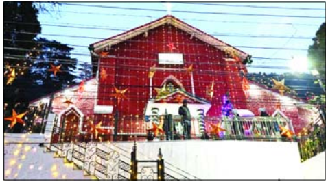
आयोजित किये गए। चर्च व ईसाई समुदाय के लोगों के घरों में भी प्रभु यीशु मसीह के जन्म को लेकर कैरल गए। इसके आलावा