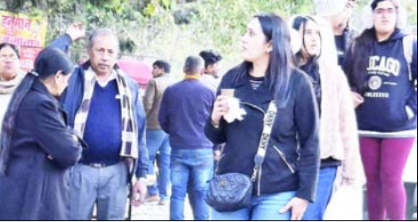
गिरिजाघरों में विशेष प्रार्थना सभाएं भी होगी। बता दें कि थर्टी फर्स्ट व नूतन वर्ष 2025 को लेकर नगर के विभिन्न होटलों में मेहमान पर्यटकों के लिए विशेष तैयारी भी की जा

रही है। हर वर्ष नववर्ष मनाने के लिए यहां सैलानियों की भीड़ रहती है, पुलिस प्रशासन ने भी तैयारी शुरू कर दी है। नगर में होटल पैक होने के बाद पुलिस द्वारा वाहनों को रूसी बाईपास में ही रोक दिया जाएगा जबकि दोपहियां वाहनों की नगर में एंटी नहीं होगी। दूसरी ओर नगर के कुछ होटल में थर्टी फर्स्ट के लिए विशेष तैयारी की जा रही है ताकि सैलानी नव वर्ष का जश्न मना सके नैनीताल होटल एंड रेस्टोरेंट एसोसिएशन के अध्यक्ष दिव्यज