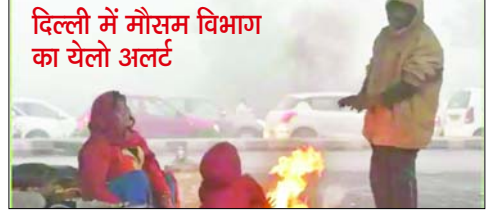
दिल्ली में मौसम विभाग का चेले अलर्ट