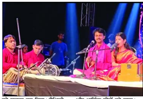
को मजबूर कर दिया। मैथिली ठाकुर कुमाऊं और गढ़वाली गीतों के साथ-साथ सांस्कृतिक और धार्मिक गीतों को गाया। इस दौरान मुख्यमंत्री पुष्कर सिंह धामी मैथिली ठाकुर के गीतों

हमारे संवाददाता हल्द्वानी में पांच दिवसीय कुमाऊं द्वार महोत्सव का आयोजन किया गया है। आयोजन के पहले दिन महोत्सव का उद्घाटन करने उत्तराखंड के मुख्यमंत्री पुष्कर सिंह धामी हल्द्वानी पहुंचे जहां एमबी ईंटर कॉलेज मैदान में महोत्सव का उद्घाटन करते हुए आयोजकों को बधाई दी। उद्घाटन के पहले दिन देश की जानी-मानी लोक गायिका मैथिली ठाकुर कार्यक्रम में अपने गीतों से लोगों को झूमने