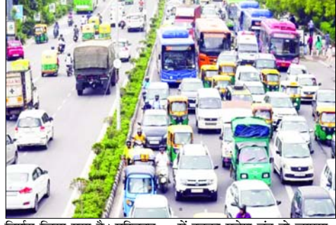
निर्णय लिया गया है। परिवहन निगम के पास बड़ी संख्या में बीएस-4 बसें हैं। चूँकि दिल्ली में इनका प्रवेश बंद हो जाएगा, इसलिए दिल्ली की सेवा प्रभावित होने की आशंका को

देहरादून हमारे संवाददाता दिल्ली मार्ग पर परिवहन निगम 70 सीएनजी बसें चलाएगा। अगले महीने से केवल 6 बीएस या सीएनजी की बसें ही दिल्ली जा पाएंगी। परिवहन निगम राज्य के विभिन्न शहरों से दिल्ली के लिए 70 सीएनजी बसें अनुबंध पर संचालित करेगा। इसके लिए निगम ने निविदा जारी कर दी है। दिल्ली में बीएस-4 बसों का प्रवेश अक्टूबर से बंद होने जा रहा है, जिसके उपाय के तौर पर ये