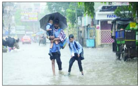
पिथौरागढ़, बागेश्वर, चंपावत और नैनीताल में भारी बारिश का येलो अलर्ट जारी किया गया है। अन्य जिलों में भी जगह-जगह तीव्र बारिश होने के आसार हैं। बारिश और मलबा आने से मार्गों पर आवागमन प्रभावित

देहरादून। हमारे संवाददाता बागेश्वर, चंपावत और नैनीताल में भारी बारिश का येलो अलर्ट जारी किया गया है। उत्तराखंड में दिनभर बादल छाए रहने के बाद देर रात मौसम ने करवट बदली। राजधानी देहरादून में झमाझम बारिश हुई। जिससे तापमान में भी कुछ गिरावट दर्ज की गई। वहीं, मौसम विभाग के अनुसार 30 सितंबर तक प्रदेश में विभिन्न जिलों में बारिश की संभावना बनी रहेगी। जबकि आज देहरादून, टिहरी,