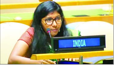
व्यापार और अंतरराष्ट्रीय अपराध के लिए वैश्विक रूप से बदनाम और सेना द्वारा संचालित देश ने दुनिया के सबसे बड़े लोकतंत्र पर हमला करने का दुस्साहस किया है। पाकिस्तानी प्रधानमंत्री के भाषण में भारत के संदर्भ के बारे में बात कर रही हूँ। जैसा कि दुनिया जानती है, पाकिस्तान लंबे समय से अपने पड़ोसियों के खिलाफ सीमा पार आतंकवाद को हथियार के रूप में इस्तेमाल किया है। इसने हमारी संसद, हमारी वित्तीय राजधानी मुंबई, बाजारों और तीर्थयात्रा मार्गों पर हमला किया है। यह सूची