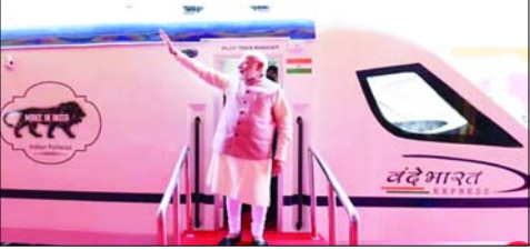
वाराणसी कैंट स्टेशन पहुंचेगी। यह ट्रेन दोपहर में 2.25 बजे गया से हावड़ा के लिए रवाना होगी और रात करीब आठ बजे तक हावड़ा पहुंचेगी। इसके बाद हावड़ा से अगले दिन सुबह 6.50 बजे चलेगी और दोपहर में करीब 1.20 बजे गाना जंक्शन पहुंचेगी। यह ट्रेन कोडरमा, पारसनाथ, धनबाद, प्रधानखन्टा, आसनसोल, दुर्गापुर से होकर गुजरेगी। आगरा कैंट स्टेशन से वाराणसी के बीच चलने वाली यह वंदे भारत एक्सप्रेस ट्रेन टूंडला जंक्शन, इटावा, कानपुर सेंट्रल, प्रयागराज से होकर गुजरेगी। आगरा से सुबह छह बजे चलकर यह ट्रेन दोपहर में करीब एक बजे वाराणसी पहुंचेगी। साथ ही दोपहर में 3.20 बजे यह ट्रेन वापस आगरा के लिए रवाना हो जाएगी। यह ट्रेन सुबह छह बजे हावड़ा से चलेगी और खड़गपुर, टाटानगर, चक्रधरपुर होते हुए 11.50 बजे तक राउरकेला पहुंचेगी। दोपहर में करीब 1.40 बजे यह ट्रेन वापस हावड़ा के लिए रवाना होगी। यह ट्रेन सप्ताह में छह दिन संचालित हो सकती है। यह ट्रेन सुबह छह बजे टाटानगर से रवाना होकर सात घंटे की दूरी तय कर बिहार की राजधानी पटना पहुंचेगी। वापसी में यह ट्रेन दोपहर में तीन बजे पटना से रवाना हो जाएगी और रात करीब 11 बजे टाटानगर पहुंचेगी।

नई दिल्ली एजेंसी हावड़ा-गया वंदे भारत एक्सप्रेस ट्रेन दोपहर में 2.25 बजे गया से हावड़ा के लिए रवाना होगी और रात करीब आठ बजे तक हावड़ा पहुंचेगी। इसके बाद हावड़ा से अगले दिन सुबह 6.50 बजे चलेगी। प्रधानमंत्री नरेंद्र मोदी 15 सितंबर को देश के विभिन्न राज्यों को 10 नई वंदे भारत एक्सप्रेस ट्रेनों की सौगात देंगे। ये ट्रेनें उत्तर प्रदेश, पश्चिम बंगाल, ओडिशा, बिहार, छत्तीसगढ़, झारखंड, कर्नाटक, तेलंगाना, आंध्र प्रदेश और महाराष्ट्र के कई शहरों से होकर गुजरेगी। जिससे इन शहरों में रहने वाले लोगों को काफी फायदा होगा। नई 10 वंदे भारत एक्सप्रेस ट्रेनों में से तीन अकेले ओडिशा को मिलेंगी। यह ट्रेन झारखंड के देवघर से वाराणसी के कैंट स्टेशन के बीच चलेगी। यह ट्रेन सुबह वाराणसी से देवघर के लिए रवाना होगी और फिर शाम तीन बजे देवघर से चलकर वापस