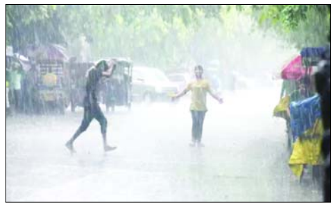
साथ भारी से भारी बारिश का रेड अलर्ट जारी किया गया है। उत्तरकाशी, टिहरी, चमोली, रुद्रप्रयाग, अल्मोड़ा और पिथौरागढ़ जिले में भारी बारिश का ऑरेंज अलर्ट जारी किया गया है। केंद्र की ओर से 12 और 13 सितंबर के लिए विशेष

देहरादून हमारे संवाददाता मौसम विभाग ने हिदायत दी है कि संवेदनशील इलाकों में रहने वाले लोग दिन के साथ रात को भी सतर्कता से रहें। इसके अलावा अगर आवश्यक न हो तो पर्वतीय इलाकों में यात्रा करने से बचें। उत्तराखंड के पर्वतीय जिलों में आज (बृहस्पतिवार) भारी से भारी बारिश होने की संभावना है। मौसम विज्ञान केंद्र ने देहरादून समेत हरिद्वार, पौड़ी, बागेश्वर, नैनीताल, चंपावत और ऊधमसिंह नगर जिले में बिजली चमकने के