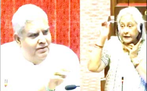
बात कर रही हैं बस बहुत हुआ। आप होंगे सेलिब्रिटी, लेकिन आपको यहां सदन की गरिमा का ध्यान रखना होगा। इसके बाद राज्यसभा सदस्य जया बच्चन ने बाद में मीडिया से बातचीत में कहा, वो डॉटने वाले कौन होते हैं, मैं यह स्वतंत्रता किसी और को नहीं दे सकती। मेरे साथ अपमानजनक बर्ताव हुआ। वहां लहजा खराब है, कितना हम सहन करें? सत्तापक्ष के लोग कुछ भी बोलते हैं, उस पर हम कुछ कहें तो कहा जाता है कि चैम्बर में आकर बात करें। हम चैम्बर में क्यों जाएं? वहां फ्लोर पर ही बात होनी चाहिए। जया बच्चन ने कहा, वो बुद्धिहीन जैसे शब्दों का इस्तेमाल कर रहे हैं। वो कहते हैं कि आप होंगी सेलिब्रिटी, हम परवाह नहीं करते। मत कीजिए परवाह, मैं सेलिब्रिटी नहीं, राज्यसभा सदस्य की हैसियत से यहां हूँ।

नई दिल्ली एजेंसी संसद के मानसून सत्र के दौरान एक बार फिर सभापति जगदीप धनखड़ और विपक्षी नेताओं के बीच तनानी देखी गई। आज उच्च सदन की सदस्य जया बच्चन और उपराष्ट्रपति जया बच्चन आमने-सामने आ गए। जया बच्चन ने कहा कि मैं जया अमिताभ बच्चन यह बोलना चाहती हूँ कि मैं कलकार हूँ। बाँड़ी लैबेज समझती हूँ और चेहरे की अभिव्यक्ति समझती हूँ। सर! माफ कीजिएगा, आपका लहजा स्वीकार्य नहीं है। भले ही आप आसन पर बैठे हैं, लेकिन हम आपके साथी हैं। इस पर सभापति धनखड़ ने सख्त लहजे में कहा, जया जी, कृपया अपने स्थान पर बैठिए। आपने अपनी एक प्रतिष्ठा बनाई है। आप जानती हैं कि अभिनेता निर्देशक के अनुसार काम करता है। आपने वह चीजें नहीं देखी हैं, जो मैंने यहां इस आसन पर बैठकर देखी हैं। आप मेरे लहजे के बारे में