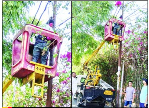
● वार्ड-पांच में एक साल से खराब स्ट्रीट लाइट अब दुरुस्त की।

पीड़ित ने उक्त लोगों से जान माल का खतरा बताते हुए पुलिस से हमलावरों के खिलाफ कार्रवाई की मांग की। समाचार लिखे जाने तक इस मामले में रिपोर्ट दर्ज नहीं हो सकी थी। पुलिस का कहना था कि पुलिस मामले को जांच कर रही है।