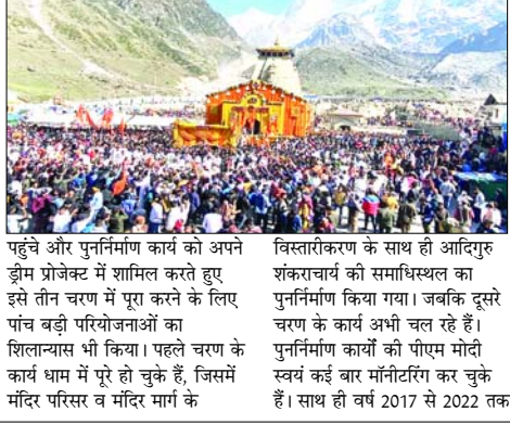
वह 6 बार केदारनाथ भी पहुंच चुके हैं। पुनर्निर्माण कार्यों के बीच बाबा केदार की यात्रा प्रतिवर्ष रफ्तार भी पकड़ रही है। इसका अंदाजा इसी बात से लगाया जा सकता है कि वर्ष 2017 में केदारनाथ में दर्शनार्थियों का आंकड़ा 4.71 लाख था। वहीं, 2018 में 9 लाख से अधिक और 2019 में 10 लाख से ज्यादा श्रद्धालु बाबा केदार के दर्शन को पहुंचे थे। वर्ष 2020 व 2021 में कोरोनाकाल के बीच आखिरी महीनों में यात्रा ने नई उपलब्धियां हासिल कीं। जबकि 2022 में 15.63 लाख और 2023 में केदारनाथ में रिकॉर्ड 19 लाख से अधिक शिव भक्तों ने दर्शन किए।

हमारे संवाददाता केदारनाथ यात्रा में प्रतिवर्ष नए रिकॉर्ड बन रहे हैं। साथ ही कारोबार के लिहाज से भी यात्रा ऐतिहासिक उपलब्धियां हासिल कर रही है। इस वर्ष 10 मई से शुरू हो रही यात्रा के दस दिनों में ही रिकॉर्ड 2.81 लाख श्रद्धालु बाबा केदार के दर्शन कर चुके हैं। इनमें से 1.26 लाख श्रद्धालु बांटे चार दिनों में ही धाम पहुंचे हैं। पंच केदार में प्रमुख व भावान आशुतोष के द्वादश ज्योतिर्लिंगों में एक केदारनाथ धाम में बीते नौ वर्ष से पुनर्निर्माण कार्य चल रहे हैं। वर्ष 2017 में प्रधानमंत्री नरेंद्र मोदी धाम