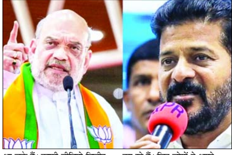
आ चुके हैं। काफी वीडियो डिलीट करवा दिए गए हैं, लेकिन इसके बाद भी लोग इसे एक्स पर पोस्ट कर रहे हैं। जिन लोगों ने अपने हैंडल से इसे पोस्ट किया है, पुलिस उन सभी को पूछताछ के लिए बुला रही है। दिल्ली पुलिस की स्पेशल सेल की साइबर विंग इंटीलजेंस पयूजन व स्ट्रेटजिक ऑपरेशन (आईएफएसओ) के वरिष्ठ अधिकारी के अनुसार, जांच नालांड, झारखंड, तेलंगाना, यूपी, एमपी, राजस्थान, हरियाणा और दिल्ली तक फैल चुकी है। दिल्ली के आम विहार निवासी एक व्यक्ति को भी नोटिस दिया गया है। हालांकि, इस व्यक्ति का कहना है कि उसका मोबाइल कोई और इंस्टाल कर रहा है। नोटिस देने के लिए पुलिस की अलग-अलग टीमों भेजी गई हैं। फर्जी वीडियो वायरल करने वाले

एजेन्सी फर्जी वीडियो के मामले में पुलिस कहना है कि फर्जी वीडियो को एक्स पर डालने वाले 25 से ज्यादा लोगों के नाम सामने आ चुके हैं। गृहमंत्री अमित शाह के फर्जी वीडियो के मामले में दिल्ली पुलिस ने अब तक 8 राज्यों में 16 से ज्यादा लोगों को नोटिस जारी किए हैं। इनमें हरियाणा में कांग्रेस के वरिष्ठ नेता कैप्टन अजय यादव भी शामिल हैं। पुलिस कहना है कि फर्जी वीडियो को एक्स पर डालने वाले 25 से ज्यादा लोगों के नाम सामने