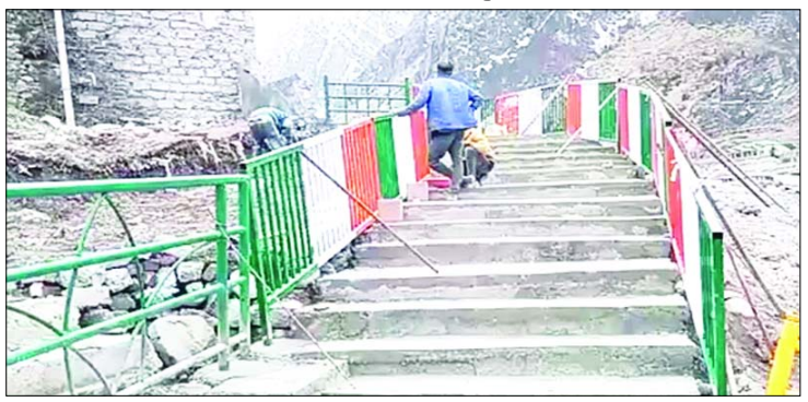
100 मीटर का नया रास्ता बनाया जा रहा है।

हमारे संवाददाता इस साल बदरीनाथ धाम की यात्रा 12 मई से शुरू हो रही है। ऐसे में बदरीनाथ धाम में मास्टर प्लान के कार्य तेजी से चल रहे हैं। यहां आस्था पथ में भी बदलाव किया गया है। बदरीनाथ धाम तक पहुंचने वाला पुराना आस्था पथ ध्वस्त होने के कारण अब साकेत तिराहे से अलकनंदा किनारे से होते हुए करीब