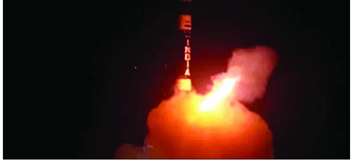
उद्देश्यों को पूरा किया। परीक्षण के दौरान विभिन्न सेंसर लगाए गए थे, जिनमें मिसाइल परीक्षण से संबंधित डाटा इकट्ठा किया गया। मिसाइल परीक्षण के दौरान सीडीएस जनरल अनिल चौहान, स्ट्रैटेजिक फोर्सस

अग्नि प्राइम मिसाइल का परीक्षण ओडिशा के डॉ. एपीजे अब्दुल कलाम द्वीप पर कल शाम करीब सात बजे किया गया। भारतीय सेना की स्ट्रैटेजिक फोर्सस कमांड ने डीआरडीओ के साथ मिलकर नई पीढ़ी की बैलिस्टिक मिसाइल अग्नि प्राइम का सफल परीक्षण किया। यह परीक्षण ओडिशा के डॉ. एपीजे अब्दुल कलाम द्वीप पर कल शाम करीब सात बजे किया गया। रक्षा मंत्रालय ने बताया कि परीक्षण के दौरान अग्नि प्राइम मिसाइल ने अपने सभी मानकों और