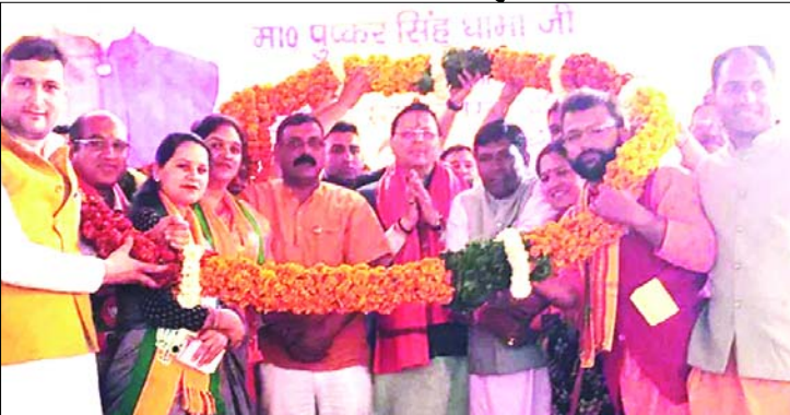
विकसित किया जा रहा है। जी 20 समेलन टिहरी में आयोजित किया गया। यह हमारे लिए गौरव की बात है। परिवारवार को बढ़ावा दिया जा रहा है। लेकिन मुझे विश्वास है जनता इसका जवाब जरूर देगी।

हमारे संवाददाता सीएम धामी ने कहा कि परिवारवार को बढ़ावा दिया जा रहा है। लेकिन मुझे विश्वास है जनता इसका जवाब जरूर देगी। लोकसभा चुनाव को लेकर सीएम पुष्कर सिंह धामी ने आज टिहरी के घनसाली पहुंचे। यहां उन्होंने मुख्य बाजार में जनसभा को संबोधित किया। उन्होंने कहा कि मैं यहां पर पीएम मोदी का पैगाम लेकर आया हूँ। उत्तराखंड यूसीसी लागू करने वाला पहला राज्य है। केंद्र सरकार की महत्वाकांक्षी योजनाओं का लाभ आज हर किसी को मिल रहा है। उन्होंने कहा कि घनसाली वीरों की धरती है। टिहरी झील को पर्यटन के रूप में विकसित किया जा रहा है। जी 20 समेलन टिहरी में आयोजित किया गया। यह हमारे लिए गौरव की बात है। परिवारवार को बढ़ावा दिया जा रहा है। लेकिन मुझे विश्वास है जनता इसका जवाब जरूर देगी।