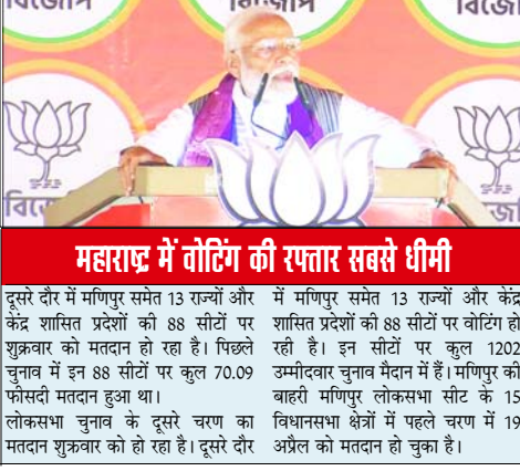
महाराष्ट्र में वोटिंग की रफतार सबसे धीमी

नई दिल्ली एजेसी पश्चिम बंगाल के मालदा में रैली को संबोधित करते हुए पीएम मोदी ने कांग्रेस और टीएमसी पर निशाना साधा है। उन्होंने कहा कि टीएमसी के राज में बंगाल में एक ही चीज चलती है- हजारों करोड़ों के स्कैम, शारदा चीट फंड, पशु तसकरी घोटाला, राशन घोटाला, कोयला घोटाले आदि। लोकसभा चुनाव के दूसरे चरण के बीच प्रधानमंत्री नरेंद्र मोदी ने पश्चिम बंगाल के मालदा में प्रचार किया। इस प्रचार के दौरान उन्होंने एक रैली को भी संबोधित किया। रैली को संबोधित करते हुए पीएम मोदी ने बताया कि आज देश में दूसरे चरण का मतदान हो रहा है और सुबह से ही लोग उत्साह और उमंग के साथ लोकतंत्र का उत्सव मना रहे हैं। मालदा में लोगों को संबोधित करते हुए पीएम मोदी ने कहा, जो लोग मतदान के लिए उत्साह से