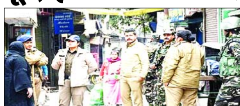
विभिन्न प्रतियोगी परीक्षाओं के विद्यार्थियों को प्रवेश पत्र दिखाने पर परीक्षा केंद्रों तक आने जाने में छूट प्रदान की गई है। साथ ही यहां पर रहने वाले स्कूलों के कार्मिकों को परीक्षा केंद्र तक आने जाने में छूट दी गई है। साथ ही प्रशासन ने चेतावनी भी दी है कि अगर किसी ने भी कर्फ्यू में दी गई ढील का उल्लंघन किया तो उसके खिलाफ धारा-188 के तहत कार्रवाई की जाएगी। यह आदेश 15 फरवरी को सुबह पांच बजे से अगले आदेश आने तक जारी रहेंगे।

हलचलनी हमारे संवाददाता कर्फ्यूग्रस्त बनभूलपुरा की जनता को एक सप्ताह बाद प्रशासन ने आंशिक राहत दी है। कर्फ्यू वाले बनभूलपुरा इलाके में गुरुवार को सुबह 9 बजे से 11 घंटे की ढील प्रदान की गई है। इस दौरान लोगों को अपने क्षेत्र से बाहर जाने की इजाजत नहीं होगी। वहीं दूसरी प्रशासन की ओर से गौजाजाली, रेलवे बाजार, एफसीआई गोदाम परिसर आदि क्षेत्र में सुबह 9 बजे से अपराह्न 4 बजे तक कर्फ्यू में ढील दी गई है। एक सप्ताह बाद इन क्षेत्रों में लोग अपने घरों से बाहर निकले और शुरू करने। लोग केवल सामान खरीदने के लिए दुकानों तक ही आवागमन कर सकेंगे। जबकि अन्य क्षेत्रों में आवागमन पर प्रतिबंध रहेगा। इसके अलावा कर्फ्यूग्रस्त बनभूलपुरा में रहने वाले बोर्ड परीक्षाओं, विवि परीक्षाओं व